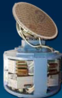
Усовершенствованная активная радиолокационная головка самонаведения 9Б-1103М-350