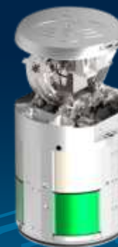
Активная радиолокационная головка самонаведения 9Б-1103М1